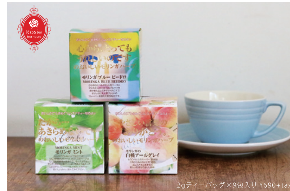
2gティーバッグ×9包入り ¥690+tax