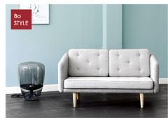
【展示商品】 Spark Back Sofa SOBORG CHAIR No1 Sofa 他