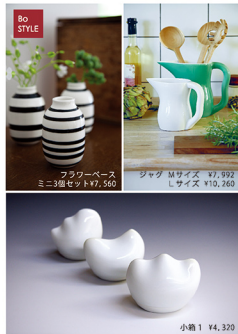
フラワーベース ミニ3点セット ¥7,560